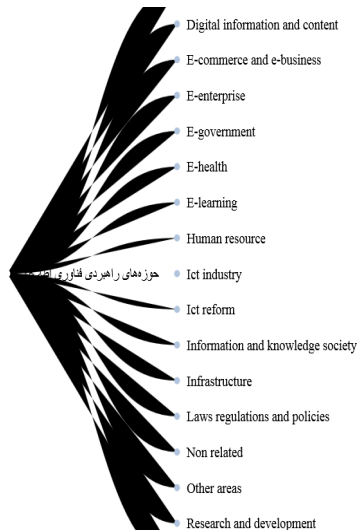
شکل ۱. حوزه‌های راهبردی فناوری اطلاعات (پروژه استخراج حوزه‌های راهبردی فناوری اطلاعات از اسناد ملی ایران و سایر کشورها)

(۶ سند به زبان فارسی و ۱۰۸ سند به زبان انگلیسی) به‌عنوان اسناد راهبردی کشورها در زمینه فناوری اطلاعات انتخاب شد. در گام بعدی، موضوع‌های راهبردی در سه سطح از اسناد استخراج و پس از پالایش و دسته‌بندی اولیه توسط تیم تحقیق، دسته‌بندی نهایی با استفاده از نظرهای گروهی از خبرگان حوزه فناوری اطلاعات و ارتباطات تدوین شده است. در مرحله پایانی این پروژه اسناد راهبردی پیش‌گفته (۱۱۴ سند) و برخی اسناد مرتبط دیگر (۱۲۲۸ سند) با استفاده از روش‌های هوشمند به حوزه‌های راهبردی فناوری اطلاعات پیوست و قابل‌بازرسی شده است. بر اساس ساختار درختی نهایی ایجادشده (شکل ۱)، موضوع‌های راهبردی اصلی شامل کاربردها، فضای سایبری، اطلاعات و محتوای دیجیتال، منابع انسانی، صنعت، جامعه اطلاعاتی و دانش، زیرساخت، قوانین، مقررات، و خط‌مشی‌ها، اصلاحات، تحقیق و توسعه، و ارتباطات هستند که هر کدام به زیرشاخه‌هایی تعریف شده است.